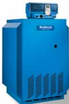
Logano G234 WS

Для него везде найдется место. Котел Logano G124 WS поставляется в полностью смонтированном состоянии, оборудованный системами автоматики и газовой горелкой предварительного смешения. Если он оснащается водонагревателем, который монтируется под котлом, для его размещения требуется площадь менее 1 квадратного метра. И при сжигании природного, и при сжигании сжиженного газа всегда достигается оптимальный результат.