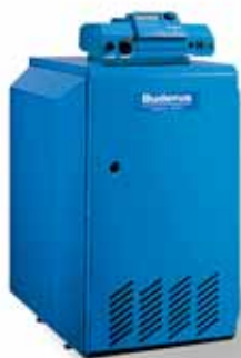
Logano G124 WS

Бесспорным преимуществом газовых отопительных котлов G124WS и G234WS является возможность стабильной работы в газовых сетях с низким давлением, что весьма актуально для российского потребителя. Котлы работают без снижения мощности до подаваемого давления газа 10 мбар. При этом серии G124WS и G234WS сохранили основные качества, присущие котлам Buderus: надежность, экономичность, компактность и отличный дизайн. В них отсутствуют движущие элементы, которые легко подвержены износу. Поэтому объем технического обслуживания таких котлов является минимальным. Поскольку газ сгорает практически без образования нагара, необходимость в проведении работ по очистке также практически отпадает.